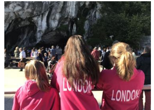
Passage à la grotte pour prier