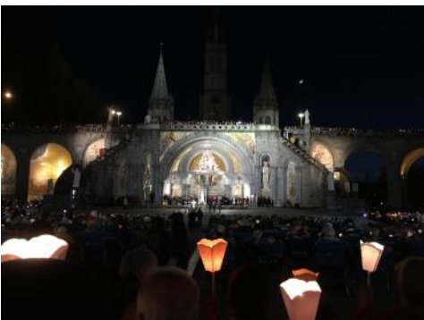
Procession mariale du mercredi soir (18 avril) avec les malades (on les voit devant nous)