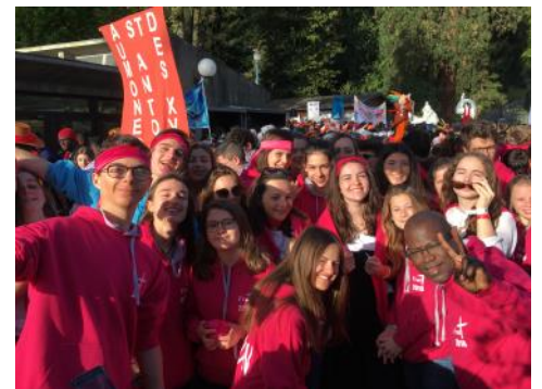
On attend avant de rentrer dans la Basilique Pie X pour la première célébration à 10 000