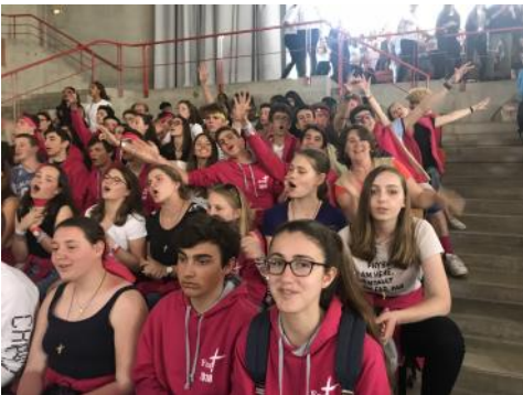
Dernière messe samedi 21 avril