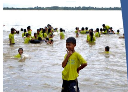
Excursion au lac Baray

A regarder les chiffres de l'activité de Notre Dame de France, l'activité de l'année passée a été bonne. Le résultat courant d'exploitation est de £124 000 comparé à un déficit de £20 000 l'an dernier. Cela est surtout dû à de meilleures rentrées locatives du Trust.